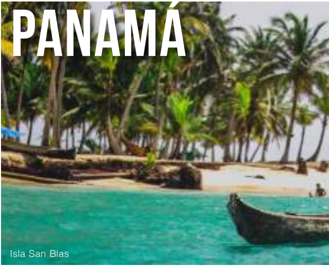
Isla San Blas